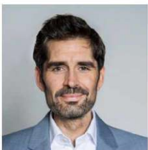
Sven Teuber Minister für Bildung