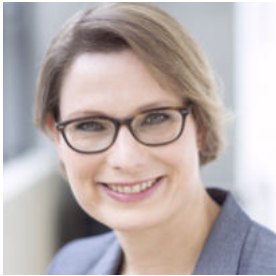
Dr. Stefanie Hubig Ministerin für Bildung